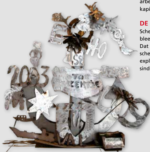
Met kunst en vliegwerk stonden we in 2003 definitief op de kaart.

Schepen bezitten en schepen kopen bleek voor ons niet het beste pad. Dat gold wel voor het bemannen van schepen en het overnemen van de exploitatie van schepen, waar we ons sinds 2012 op richtten.