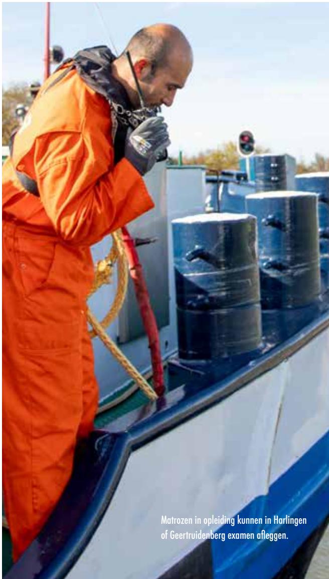
Matrozen in opleiding kunnen in Harlingen of Geertruidenberg examen afleggen.